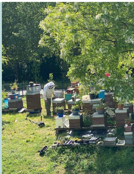
Les ruches de l'IRTS IDF Site de Neuilly-sur-Marne